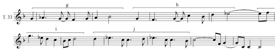
Przykład 18. Podział tematu II na cztery motywy (g, h, i, j) i codę