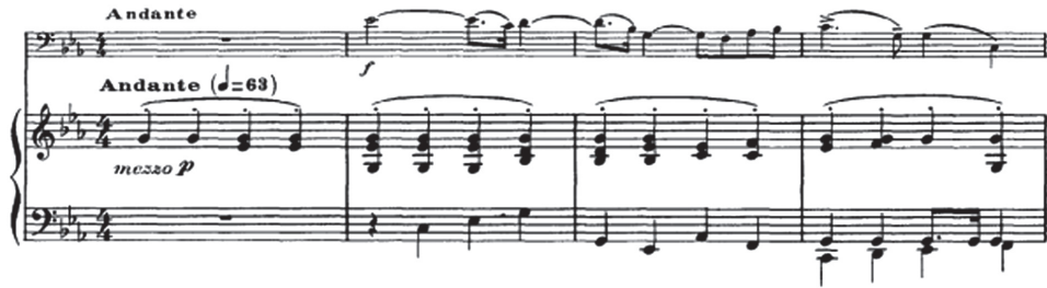
Przykład 11. Gabriel Fauré, II Sonata g-moll na wiolonczelę i fortepian op. 117, część II, temat I, takty 1–4

G. FAURÉ: Deuxième Sonate pour violoncelle et piano... , s. 17.