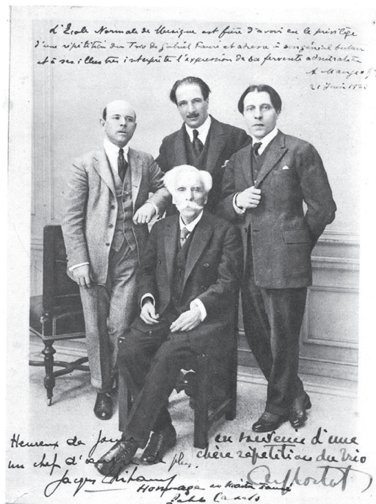
Ilustracja 1. Zdjęcie upamiętniające drugie wykonanie Tria d-moll op. 120, École Normale de Musique, 21 czerwca 1923 roku, stoją od lewej: Pablo Casals, Jacques Thibaud, Alfred Cortot, pośrodku Gabriel Fauré J.-M. NECTOUX: Fauré . Paris 1972, s. 165.

oraz części finałowej – Allegro vivo , utrzymanej w swobodnej formie sonatowej z elementami ronda. Fauré oparł kompozycję na bardzo klasycznym schemacie, na co wskazuje także układ tonacji, w jakich utrzymane są poszczególne części: pierwsza w d-moll, druga w F-dur, trzecia w d-moll z przejściem do D-dur.